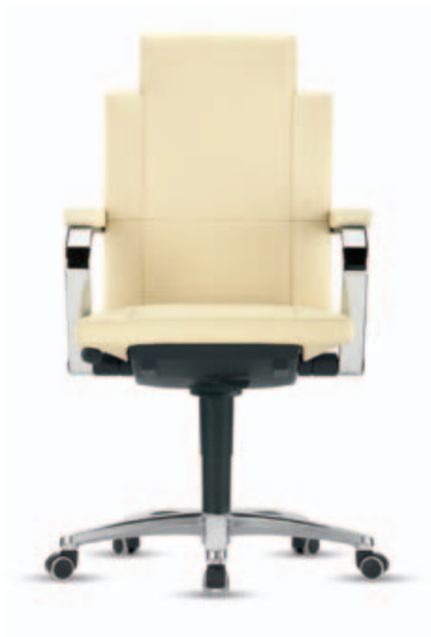
Leo II 6 A