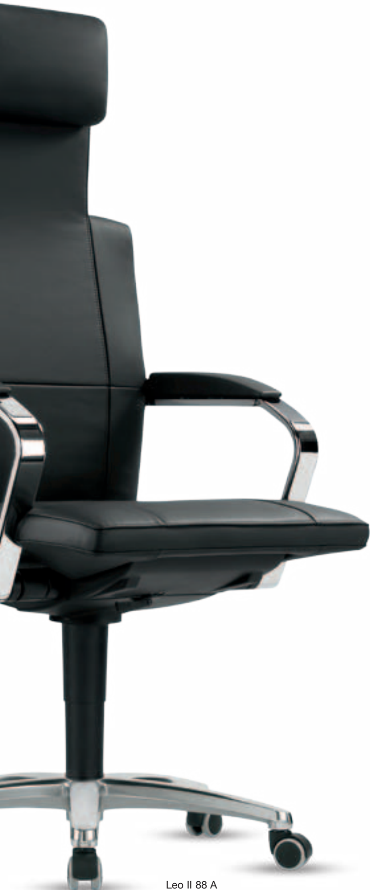
Leo II 88 A