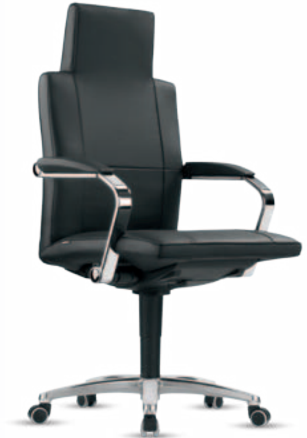
Leo II 8 A

DE Leo II. Formvollendete Eleganz in klassischem Design.