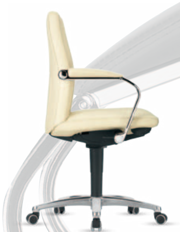
Leo II 4 A