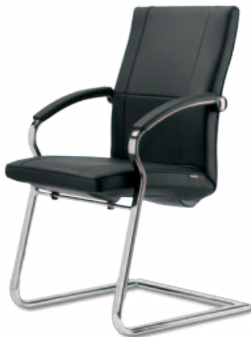
Leo II 5 A